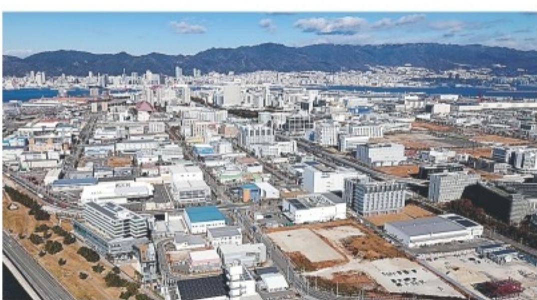
多くの企業や研究機関が集積する神戸医療産業都市＝2024年12月、神戸・ポートアイランド2期

医療産業都市は曲折を経て、国内最大級の医療産業クラスターに成長した。進出企業・団体数は、2024年11月末で357社・団体に上る。 ◇ 連載「実相 被災地経済」第7部では、阪神・淡路大震災を機に新たな歩みを始めた街の姿を描く。まずは、復興プロジェクトである医療産業都市構想から始める。(敬称略) (一部組織の名称は当時) ◇今回は7日に掲載する予定です。(西井由比子)