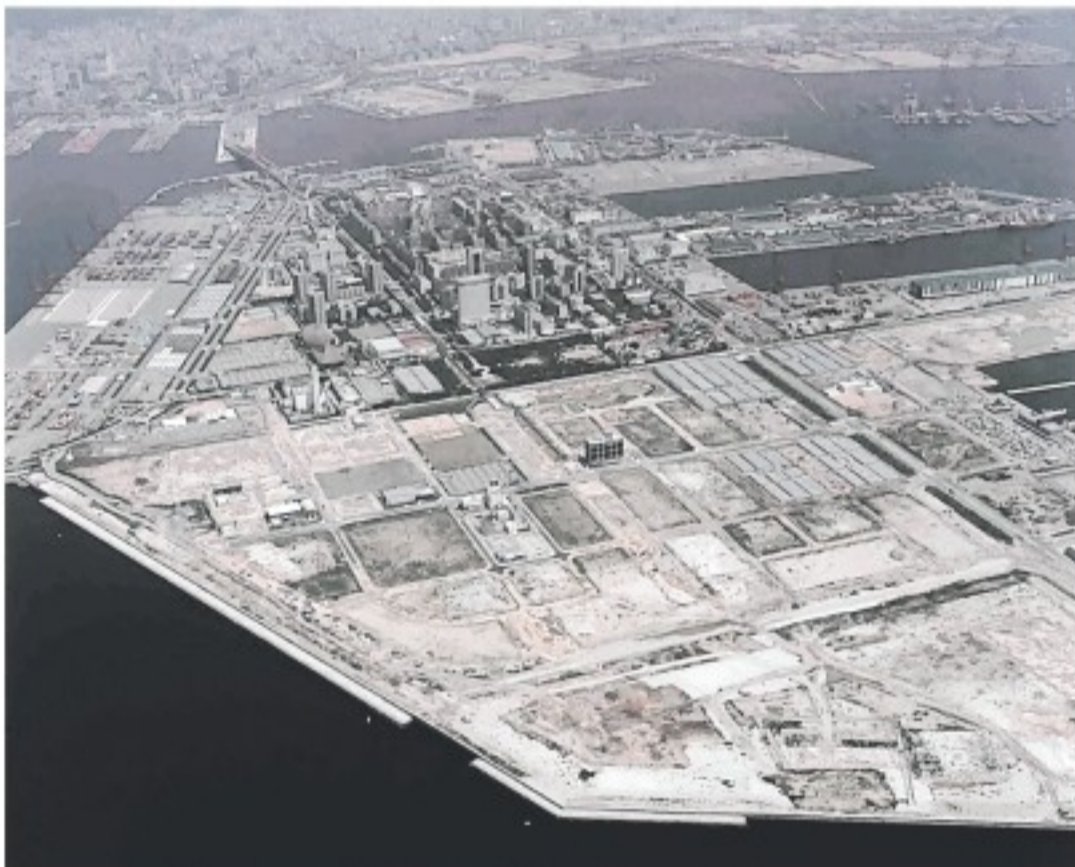
神戸医療産業都市構想の対象区域となったポートアイランド2期。ほぼ更地が広がっている＝1998年7月撮影、神戸市提供